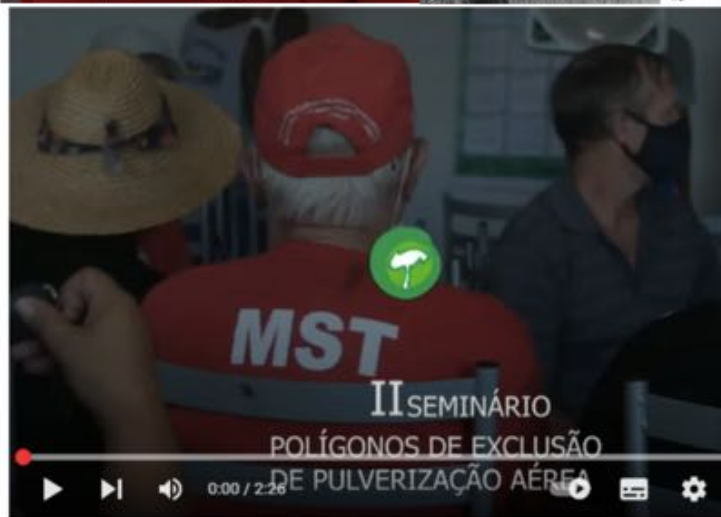
Seminário discute proibição de pulverização aérea com agrotóxicos na região metropolitana do RS