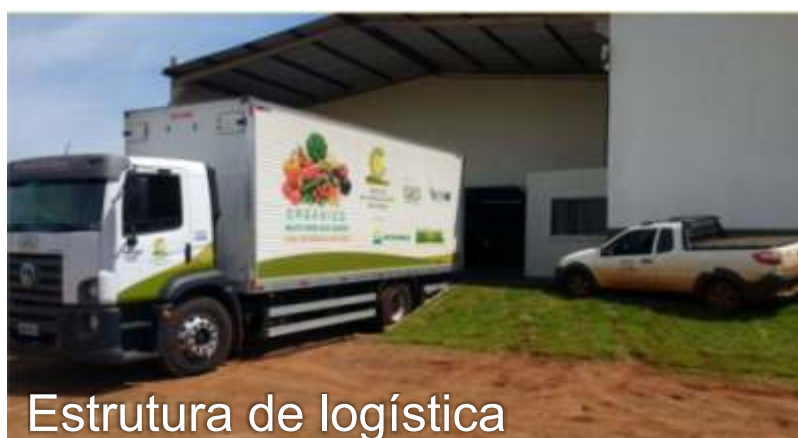
Estrutura de logística