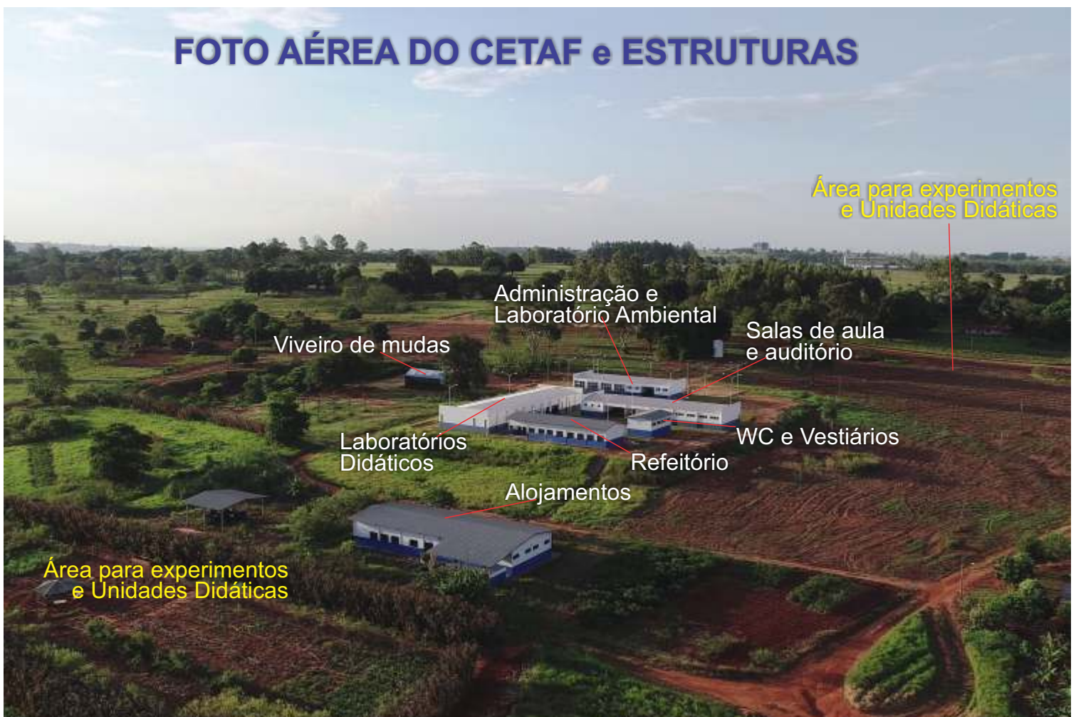
FOTO AÉREA DO CETAF e ESTRUTURAS

A gestão do CETAF foi discutida em diversas instâncias, sendo aprovado por unanimidade e criada a lei municipal de No. 1084 do município de Glória de Dourados que autorizou o poder executivo a firmar termo de gestão compartilhada com a APOMS, que assume a responsabilidade por buscar formas e meios para a operacionalização do CETAF.