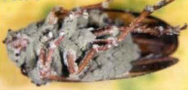
Cigarrinha atacada pelo fungo Metarhizium