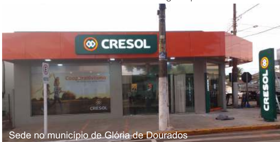
Sede no município de Glória de Dourados

Atua com recursos de diversas fontes, entre repasse do PRONAF/PRONAMP e outras linhas, BNDES, BRDE, Bancos particulares, Créditos com recursos próprios e no ano de 2018 teve seu credenciamento homologado para atuar com o FCO.