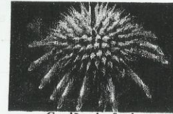
Cordão-de-frade Leonotis nepetaefolia