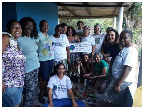
Figura 4: As mulheres do GT reunidas na roda de conversa

Menezes & Maldonado (2015) destacam o potencial das oficinas culinárias como ferramenta metodológica capaz de promover o diálogo de saberes e de práticas sociais e fomentar reflexões críticas sobre alimentação a partir de uma perspectiva ampliada que considera os aspectos culturais, econômicos, sociais e ambientais.