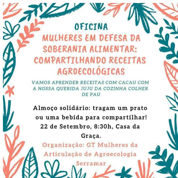
Figura 1: Imagem do cartaz de divulgação da oficina