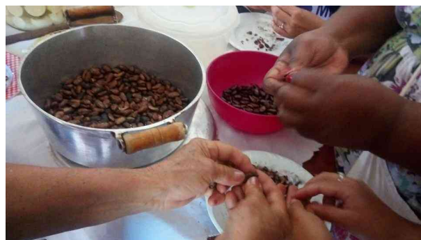
Figura 2: Início da oficina com as sementes de cacau