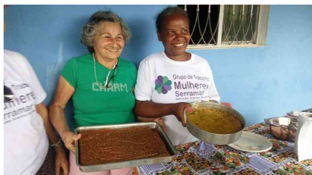
Figura 3: As agricultoras mostram uma das receitas pronta

Todavia, ao mesmo tempo em que é fundamental reconhecer o papel estratégico das mulheres, é necessário denunciar que a ausência de compartilhamento dos trabalhos domésticos, incluindo o ato de cozinhar, resulta em enorme sobrecarga das mesmas (NOBRE, 2015). Dessa forma, a luta pela soberania alimentar passa, necessariamente, pelo enfrentamento dessa dinâmica perversa e pela desnaturalização do cozinhar como um “ato de amor” das mulheres, devendo ser compartilhado por todos enquanto um ato de autocuidado, resistência e autonomia.