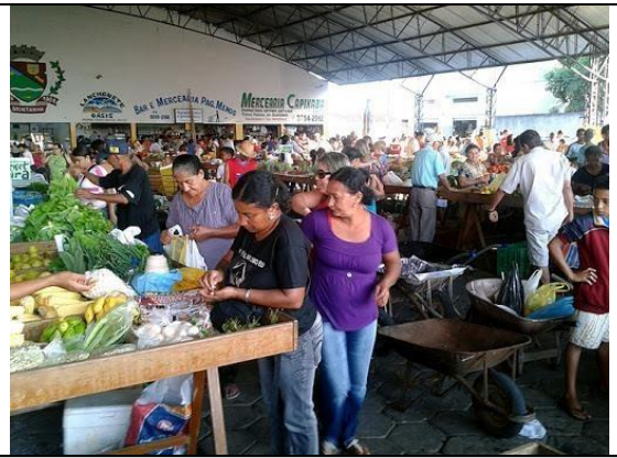
Feira da agricultura familiar de Montanha, todos os sábados