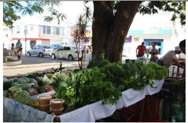
Feira agroecológica todas às quintas-feiras