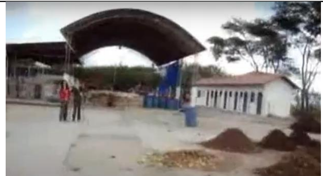
Usina de reciclagem de resíduos sólidos, centro de triagem e prensagem, fábrica de vassouras pet, fábrica de sabão e produtos de limpeza