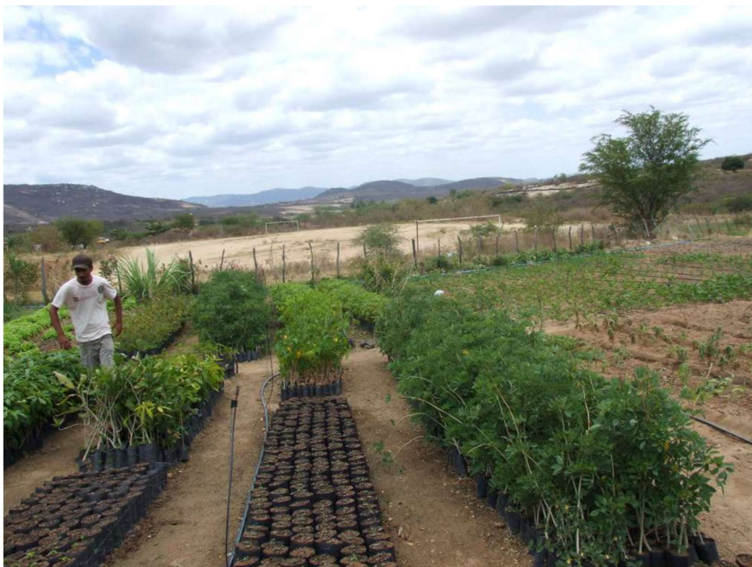
Foto 2. Sítio com canteiros de plantas fitoterápicas, insumos para o Laboratório.