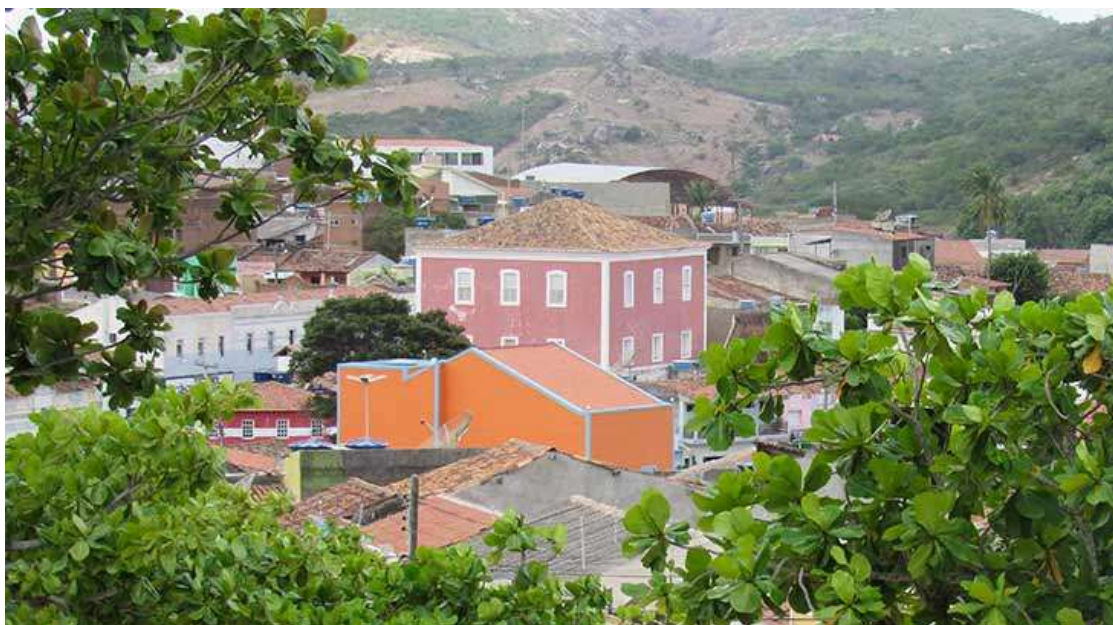
Foto 1. Vista parcial da cidade de Brejo da Madre de Deus.