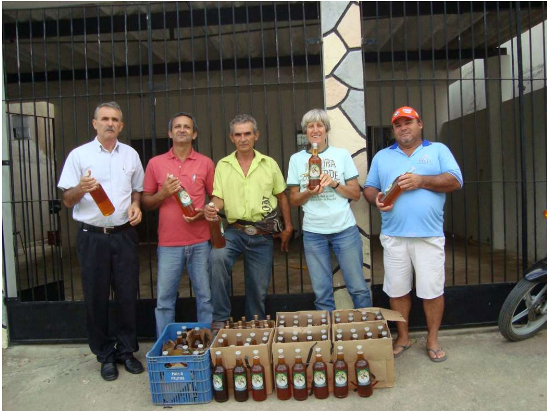
Foto 6. Mel para merenda escolar de Brejo, 2010.