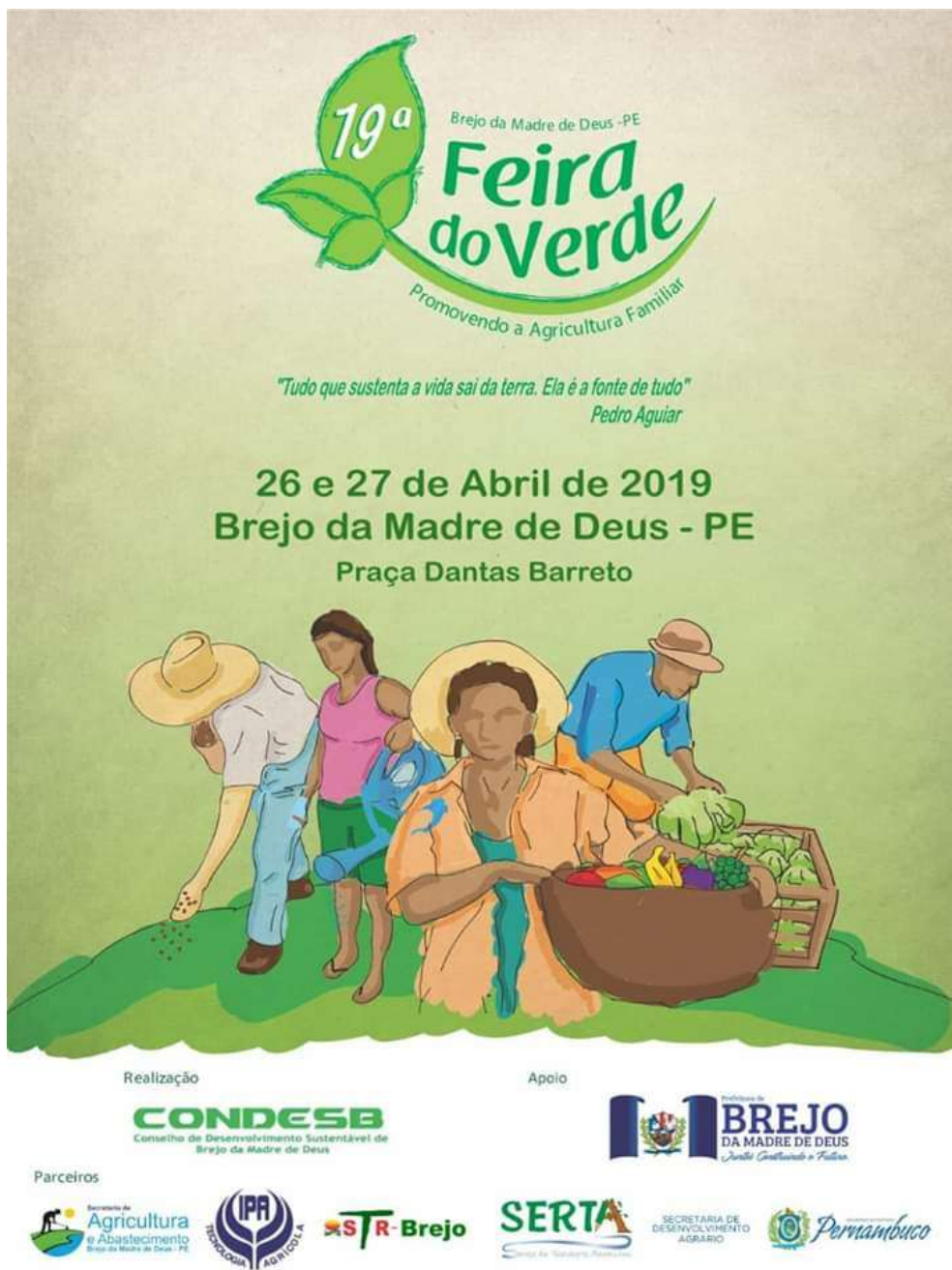
Figura 1 – Cartaz da Feira do Verde de 2019.