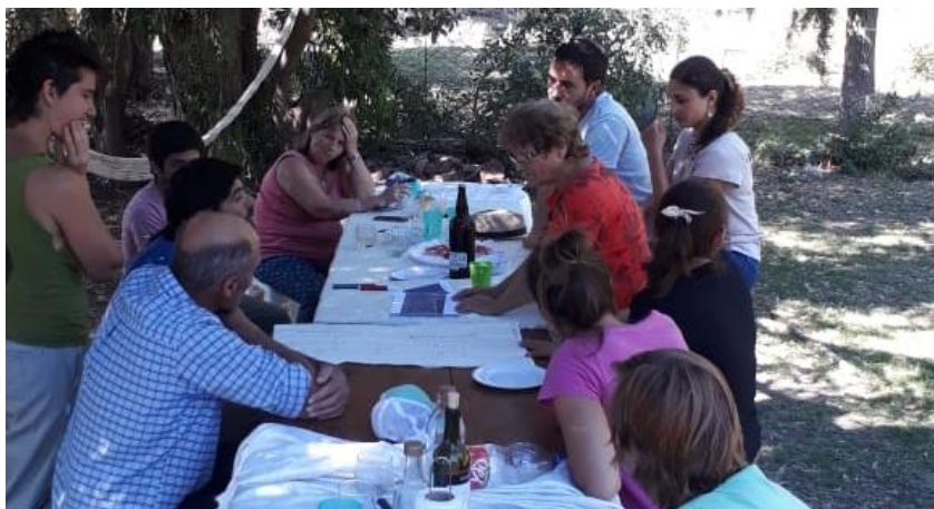
Fig. 2: Construcción grupal del mapa de recursos del establecimiento.

Taller de conocimiento del establecimiento: Luego de una charla para entrar en confianza, -o en los casos que fue necesario una ronda de presentación- se procede junto a la familia a construir en una afiche, un mapa del establecimiento, en él se ubican: las divisiones del campo, la orientación, la infraestructura y mejoras (molinos, aguadas, mangas, edificaciones, etc.) y las características topográficas, como: bajos, arroyos, lomas, afloramientos de tosca, etc.. (figura 2) También se conoce la ubicación actual de la hacienda y su composición en categorías. Sobre el afiche se registran otros datos como la existencia de maquinarias y otras herramientas de trabajo. En algunos casos surgen antecedentes, recuerdos o vivencias sobre las cualidades productivas de los distintos “parches” del campo. Por ej: “me acuerdo que en tal año en ese lote las cabezas de girasol eran así de grandes” , o “en la inundación del '85 el agua del bajo llegaba hasta aquel alambre y estuvo varios años hasta que se fue el agua” .