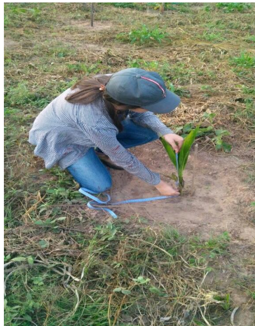
Avaliação do crescimento das espécies em SAF. Chácara Santa Márcia, Nova Xavantina-MT. (2018)