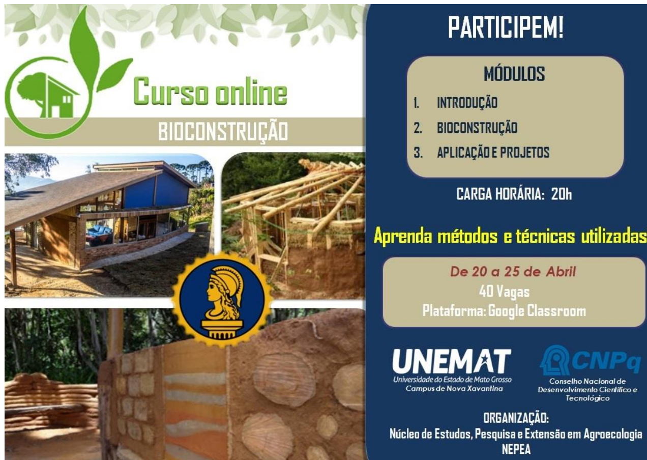
Curso de Bioconstrução (2020)