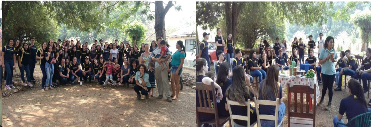
Organização e realização do Minicurso “Produção sustentável de Alimentos: tecnologias e perspectivas de mercado” na Chácara Scapini, Nova Xavantina-MT durante a X Semana Científica da Unemat Câmpus de Nova Xavantina (2019).