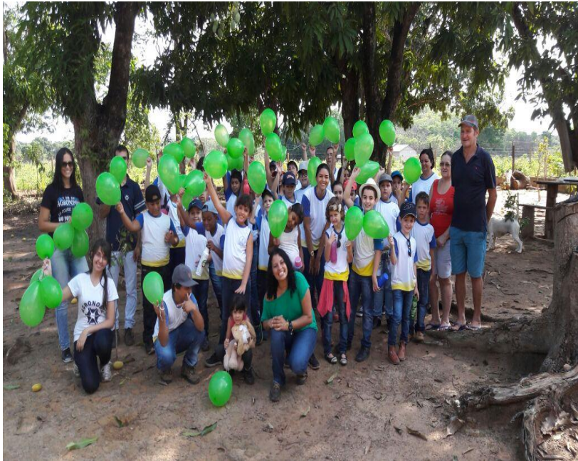
Ação de Extensão “Agricultura Familiar e Produção de alimentos”. Chácara Canarinho. (2019)