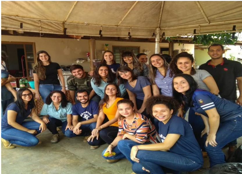
"Multifuncionalidade de Sistemas Agroflorestais: aspectos socioeconômicos, memórias e saberes na agricultura familiar" Semana Científica da Unemat-Nx (2018)