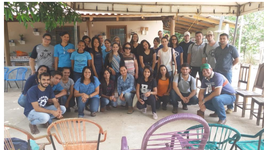
Minicurso "Sistemas Agroflorestais: Modelos e Arranjos". Semana Agrônoma da Unemat-Nx (2017).