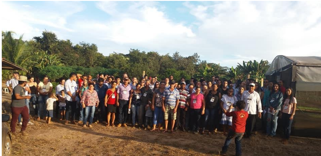
17º Dia de Campo da Agricultura Familiar- Sítio Esperança, Nova Xavantina-MT. (2019)