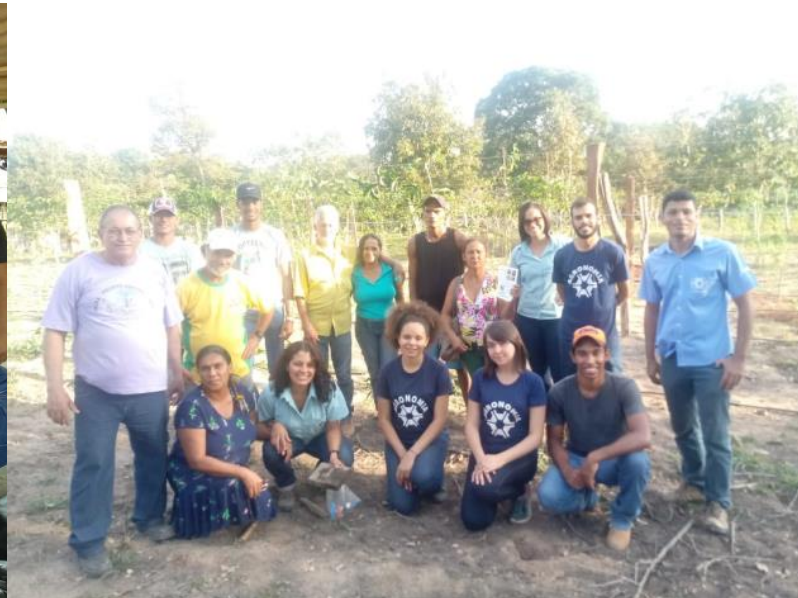
Formação em Cultivo e Produção de Maracujazeiro. Unidade Demonstrativa, Assentamento Serra Verde, Barra do Garças-MT (2018).