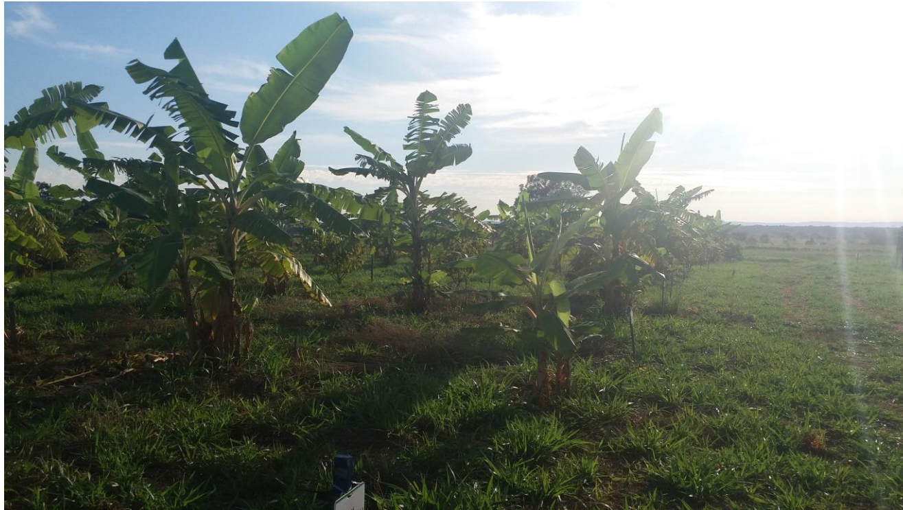
Consórcio (Bananeira, urucum, cajá, cupuaçu, crotalária) – área Experimental da Unemat Câmpus de Nova Xavantina (2020)