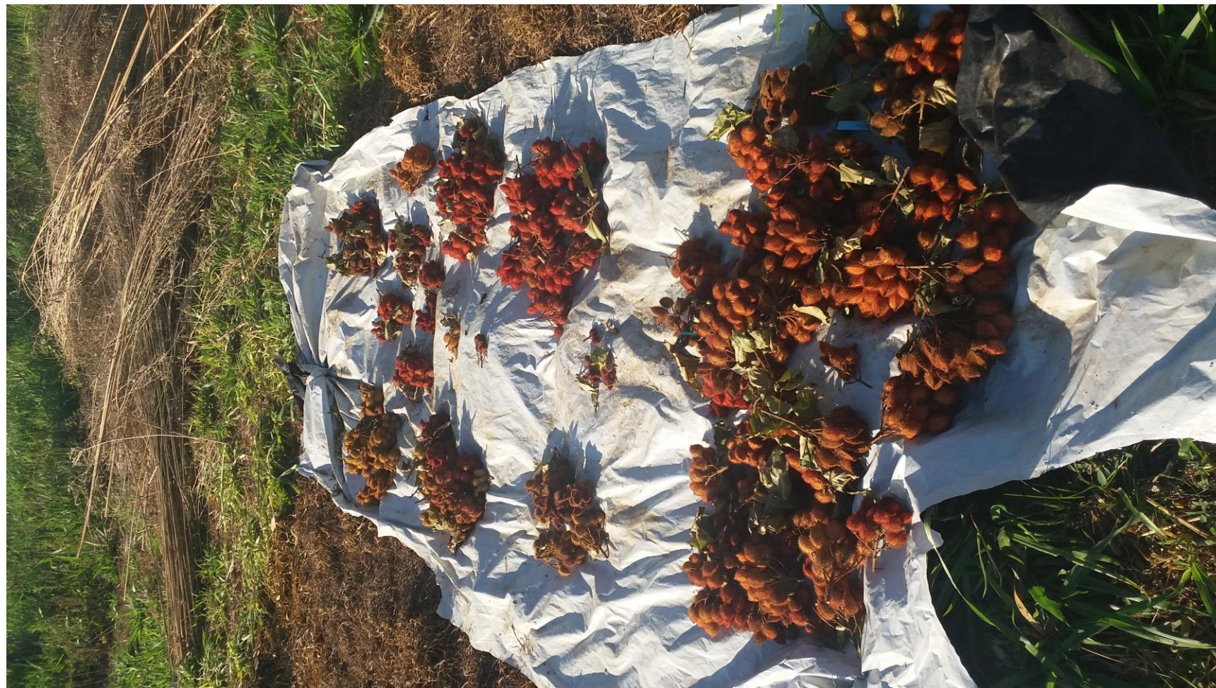
Colheita do Urucum. Unidade Experimental da Unemat câmpus de Nova Xavantina (2020)