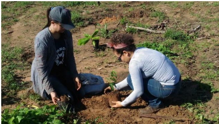
Plantio das espécies na área demonstrativa de SAFs. Chácara Santa Márcia, Nova Xavantina-MT (2018)