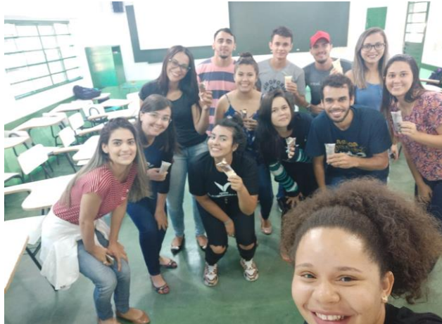
Organização e realização do Minicurso “Empreendedorismo social: Perspectivas e Oportunidades” durante a V Semana Agrônômica da Unemat Câmpus de Nova Xavantina (2019).