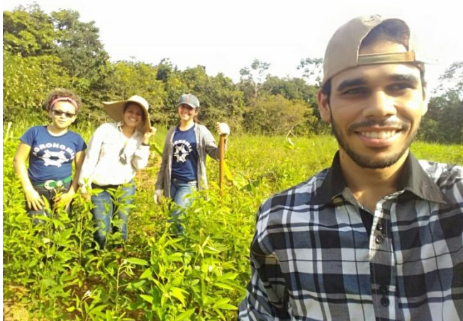
Unidade Demonstrativa de bananeira com adubação Verde . Chácara Santa Márcia, Nova Xavantina-MT (2018)