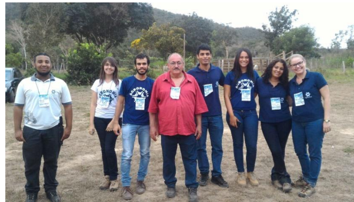
Organização do 15º Dia de Campo da Agricultura Familiar. Assentamento Serra Verde, Barra do Garças-MT. (2018)