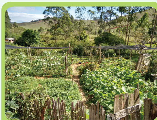
Horta da Família