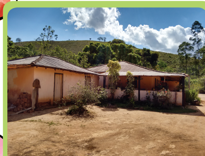
Residência da família Eliete e Denil

Material produzido a partir da Excursão Científica do Projeto Comboio de Agroecologia do Sudeste (edital 81/2013 MCTI/MAPA/MDA/MEC/MPA/CNPq), a Rede de Núcleos de Agroecologia do Sudeste, que ocorreu no município de Divino/MG.