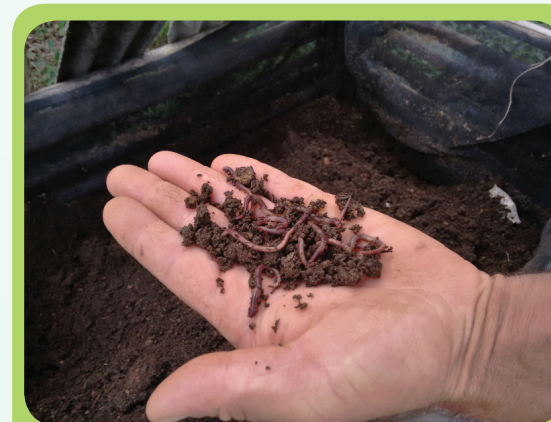
Minhoca utilizada na produção de Húmus.