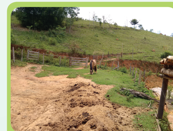
Pastagem na propriedade