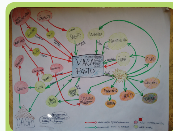
Pastagem e vaca: fluxo do que entra na pastagem e o que sai da pastagem, feito com os estudantes durante a excursão científica.

Outro desafio é o envolvimento de mais famílias com a agroecologia. Segundo a família, ainda é necessário disseminar a agroecologia em uma escala maior, e para isso faltam recursos e reconhecimen-