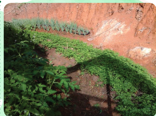
Horta da Família