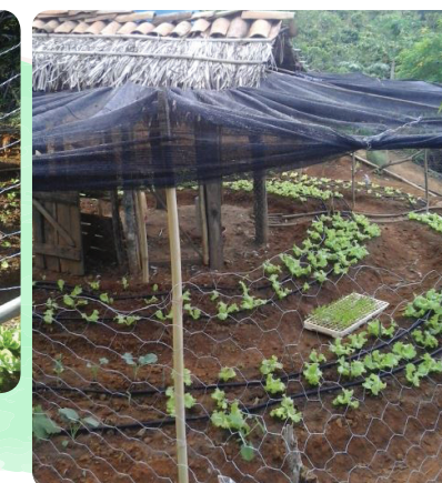
Horta Mandala, integrada com criação animal de galinhas.

o hortelã, o manjeriço, a malva e o peixinho da horta, a grande atração. Produzem muito peixinho. A produção de mudas de flores e frutíferas, também apresenta com alegria, complementa as atividades realizadas na horta e garante uma renda extra.