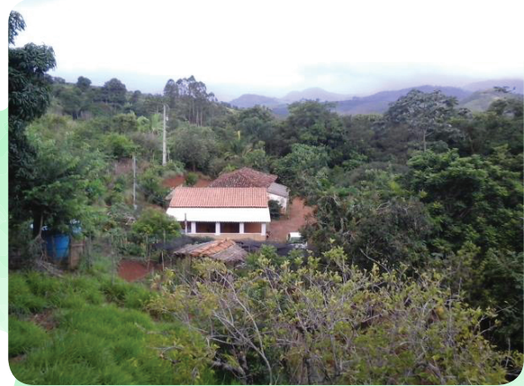
Atual casa da família, na comunidade dos Teixeiras, Divino-MG.

às casas de algumas famílias do município. Nas “batidas” de porta-em-porta para entregar os produtos toda semana, e a preço acessível, estabeleceu-se um processo de diálogo da agricultora com os consumidores. Além disso, no seu envolvimento com o movimento social e junto ao sindicato, com a feira e com as políticas públicas, como o PNAE (Programa Nacional de Alimentação Escolar), a família avançou ainda mais com o processo de comercialização e melhoria da renda.