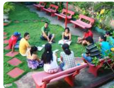
Grupo de Estudo