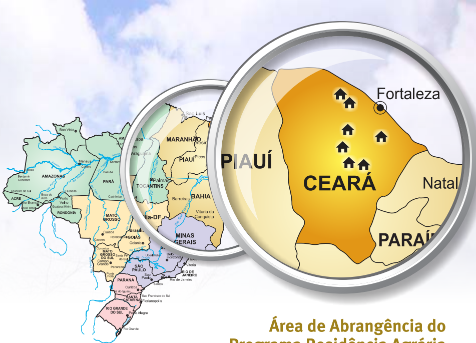
Área de Abrangência do Programa Residência Agrária