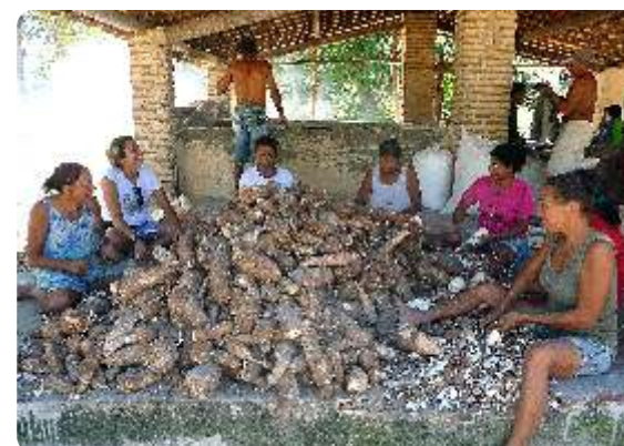
Casa de Farinha