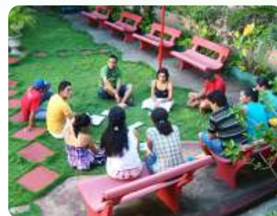
Grupo de Estudo