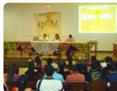
Ciclo de Debates